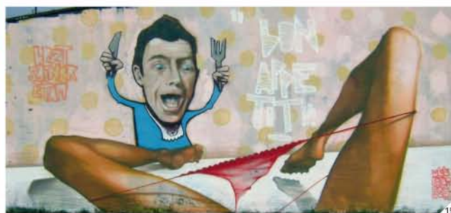
1: GOMAD (Pays-Bas) 2: SIXFRE (France) 3: GRAPHIS (Brésil) 4: DUZA (France) 5: IDO 10OTOR (France) 6: DHEO (Portugal) 7: NOSBE (France) 8: MOUN (France) 9: PLOK (France) 10: SAEM (France) 11: SONGE (France) 12: SPEK (Italie) 13: KALIS (France) 14: MARIA (Italie) 15: SAINER (Pologne)