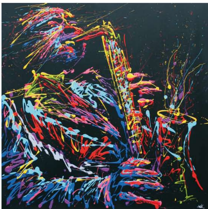
Ci-dessous: "Charlie Parker" 100x100cm. "Femme" 80x80cm. Page de droite: "Rainbow Skulls" 6x40x40cm.

★ Je peignais à la bombe des portraits durs, marqués : des gueules ! C'est la recherche de matière qui m'a poussé vers la peinture pour créer mes effets de couleur et de mouvement.